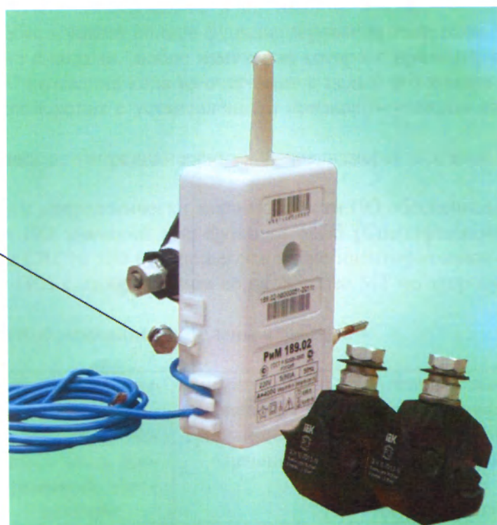
Рисунок 2 – Фотография общего вида и место установки пломбы поверителя счетчиков РИМ 189.02, РИМ 189.04