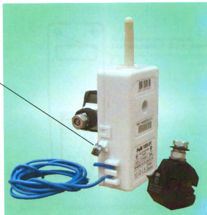
Рисунок 1 – Фотография общего вида и место установки пломбы поверителя счетчиков РИМ 189.01, РИМ 189.03