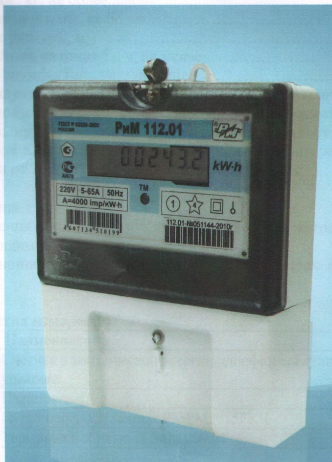
Рисунок 2 - Общий вид счетчика РиМ 112.01